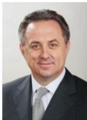
Министр спорта, туризма и молодежной политики Российской Федерации Виталий Мутко

Желаю участникам соревнований успешных стартов и новых ярких побед!