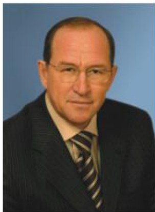
Глава г. Чебоксары Н. Емельянов

Приветствую вас в столице Чувашии и поздравляю с открытием чемпионата России по легкой атлетике!