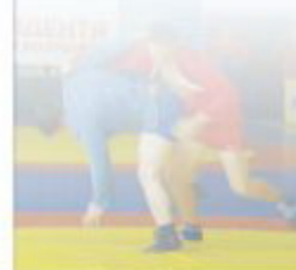
СЕРГЕЙ ЕЛИСЕЕВ Президент Всероссийской федерации самбо

Желаю спортсменам ярких и запоминающихся схваток, арбитрам бескомпромиссного судейства, а всем участникам хорошего спортивного праздника.