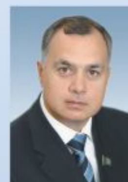
ГАВРИЛОВ С.В. Председатель Чебоксарского городского Собрания депутатов Председатель органов комитета турнира