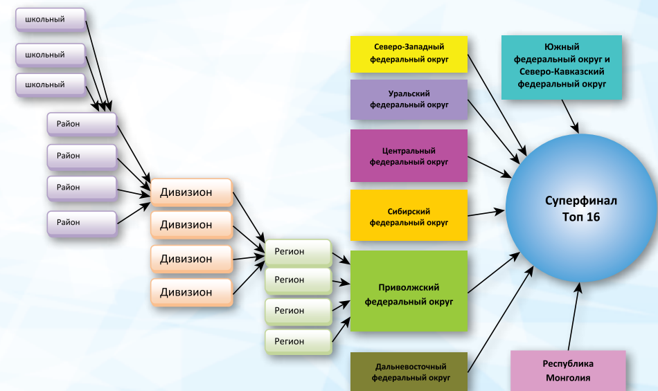
ФОРМУЛА ПРОВЕДЕНИЯ ЧЕМПИОНАТА